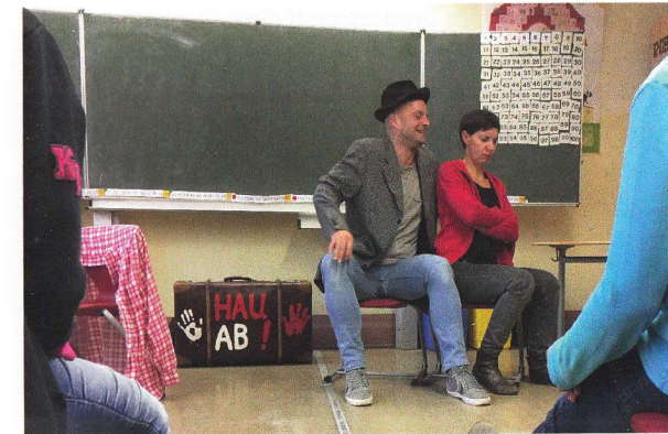
Szene aus »Hau ab«